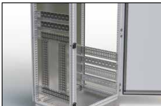
Velký výběr systémových lišt pro vytváření dalších montážních rovin a pozic pro instalace vnitřního vybavení