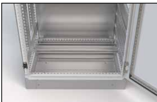
K rozvaděčům rovněž nabízíme podstavce s výškou 100 nebo 200 mm.