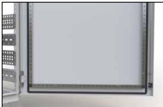
Zpevňující rámeček na dveřích s perforací pro instalaci dodatečného příslušenství