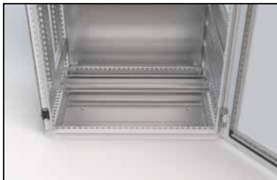
50mm prostor od země ke spodní hraně dveří umožní instalaci rozvaděče bez podstavce díky speciálně navrženému spodnímu rámu. Toto řešení nezmenšuje prostor pro vnitřní instalace.