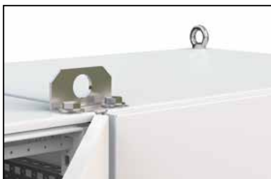
Jeřábová oka a speciálně navržené držáky umožňují i transport rozvaděčů spojených do řady