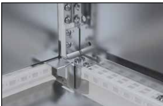
Speciální držák montážní desky umožňuje její hladké zasunutí do správné pozice